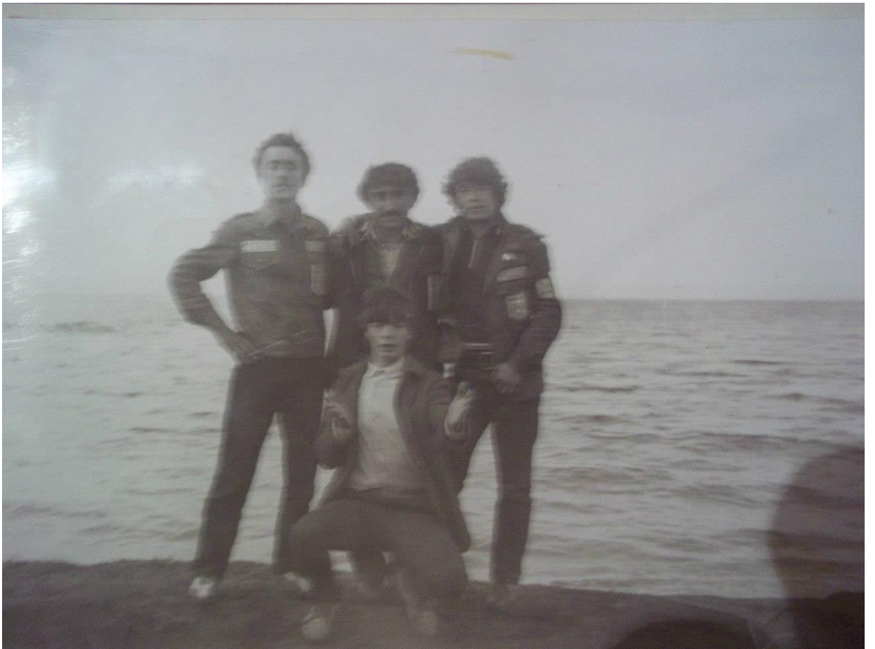
Атайым хезмэт иткән взвод Ырымбур өлкәһе Беляев районы Дон касабаһында Урал йылғаһы буйында урынлашкан булған.